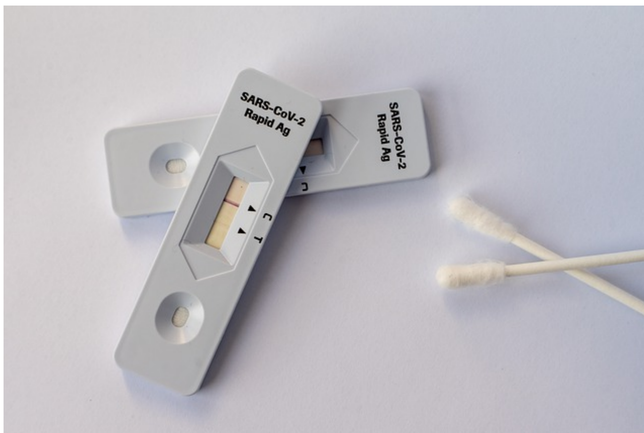
test antigénique

Dans un contexte de circulation épidémique soutenue tel que celui que nous traversons, de nombreuses épidémies localisées - dites « clusters » - sont fréquemment rapportées dans les établissements de soins, les EHPAD, mais aussi en milieu scolaire ou en entreprise.