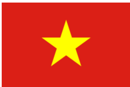
République du Viêt Nam

Les congrès quinquennaux du Parti communiste du Viêt Nam (PCVN), qui contrôle la totalité du pouvoir dans le pays, attirent toujours l'attention des observateurs, spécialement depuis le VI e congrès, tenu en 1986, surnommé le congrès du Thi M?i (changer pour faire du neuf), et considéré comme le point de départ d'une nouvelle ère nationale. Ces grand-messes sont donc suivies de très près: on s'attend à ce qu'elles annoncent les lignes directrices pour les politiques futures et désignent les principaux acteurs du régime vietnamien.